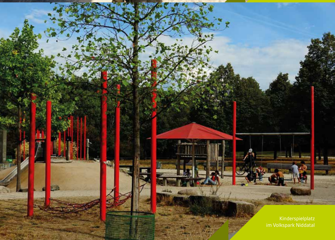
Kinderspielplatz im Volkspark Niddatal