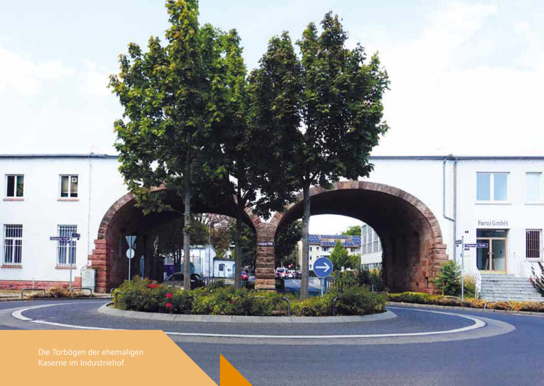
Die Torbögen der ehemaligen Kaserne im Industriehof