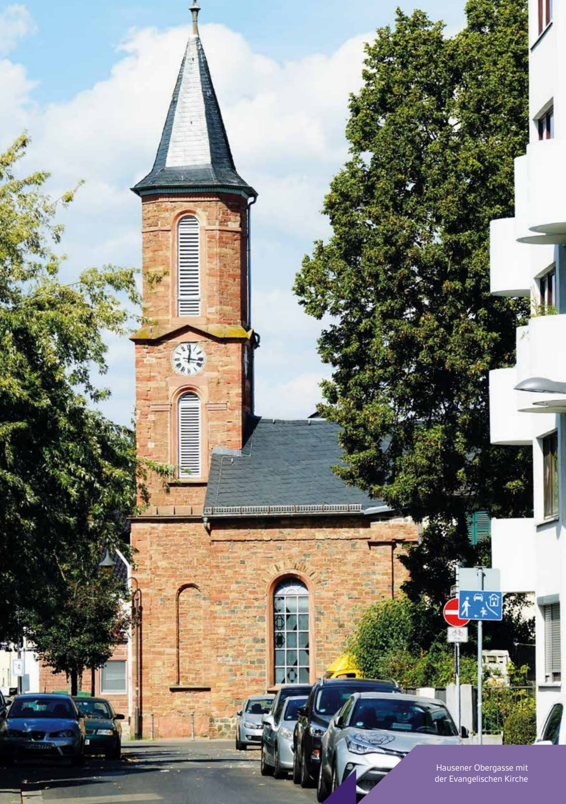
Hausener Obergasse mit der Evangelischen Kirche