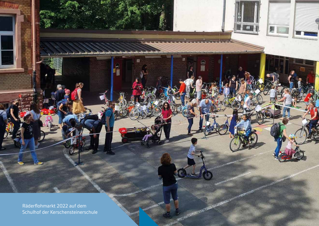
Räderflohmarkt 2022 auf dem Schulhof der Kerschensteinerschule