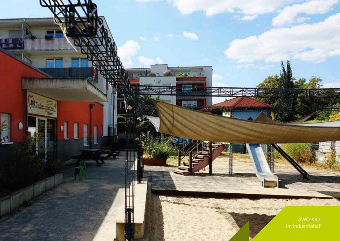
AWO-Kita im Industriefhof